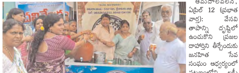
దావణ్ణి తీర్చేందుకు చలివేంద్రం ఏర్పాటు

అమదాలవలస, ఏప్రిల్ 12 (ప్రభాత వార్త): వేసవి తాపాన్ని దృష్టిలో ఉంచుకొని ప్రజల దావణ్ణి తీర్చేందుకు జనహిత సేవ సంఘం అధ్వర్యంలో పట్టణంలోని అక్షయ నారాయణ స్వామివారి ఆలయం సమీపంలో చలివేంద్రాన్ని ఏర్పాటు చేశారు.