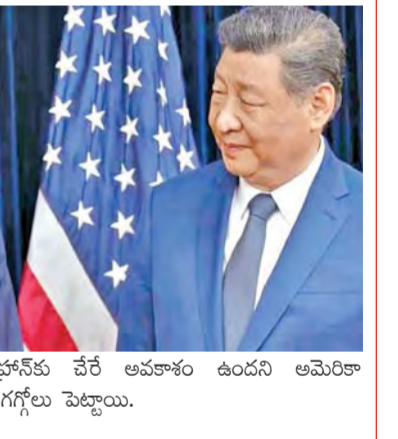
అవి టెక్నోనీకు చేరే అవకాశం ఉందని అమెరికా పత్రికలు గగ్గోలు పెట్టాయి.

మీడియా సంస్థలు తమపై నిరూపణ ఆరోపణలతో కథనాలు ప్రసారం చేస్తున్నాయని విమర్శించింది. అయితే చైనా సుదీని ఆయుధాలు అందిస్తున్న ఇరాన్ బహిరంగంగా వెల్లడించింది. కానీ, తాము అమెరికా విమానాలను విజయవంతంగా కాల్యూ డానికి చైనా ఆయుధాలను వాడలేదని, తమ ఆధునాతన రక్షణ వ్యవస్థలే యూఎస్ విమానాలను ఉపయోగపడతాయని ఇంటిజిస్ వెల్లడించింది. భుజం మీద పెట్టుకోని ప్రయోగించే పార్ట్ రేంజ్ మిస్సైల్ లాంచర్లను, ఇతర క్షిపణి వ్యవస్థలను సరఫరాచేస్తున్నదని, వారం రోజుల్లో