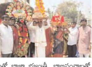
చింతామణి అమ్మవారి ఉత్సవం కవిత పురపేటలో మేక తాళాలతో భాజా భజనం, భాజనంవలతో ఉపోసనం నిర్వహించి అనంతరం శ్రీ చింతామణి అమ్మవారి దేవాలయానికి చేరుకుంది.

కవిత, ఏప్రిల్ 12 ప్రభాతవార్త: మండల కేంద్రంలో వెలసి ఉన్న శ్రీశ్రీ చింతామణి అమ్మవారి ఉత్సవం అదివారం ఘనంగా ఆ గరంగ వైభవంగా జరిగింది.