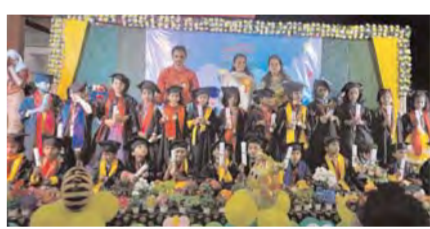
రవీంద్రభారతి స్కూల్లో కిడ్స్ కాన్వోకేషన్