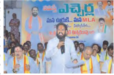
భగీరథపురంలో నమస్తే ఎచ్చెర్ల కార్యక్రమం

శ్రీకాకుళం/ఎచ్చెర్ల, ఏప్రిల్ 12: ఎచ్చెర్ల మండలం భగీరథపురంలో శాసనసభ్యులు నమస్తేడి ఈశ్వర రావు అదివారం నమస్తే ఎచ్చెర్ల కార్యక్రమం నిర్వహించారు. కార్యక్రమంలో భాగంగా 29 లక్షల విలువైన పలు సీసీ రోడ్లను ప్రారంభించారు.