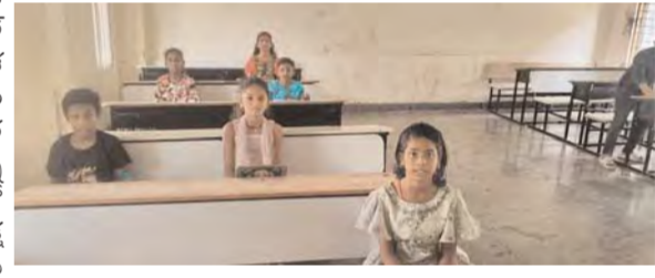
ప్రశాంతంగా ముగిసిన ఆరో తరగతి ప్రవేశ పరీక్ష