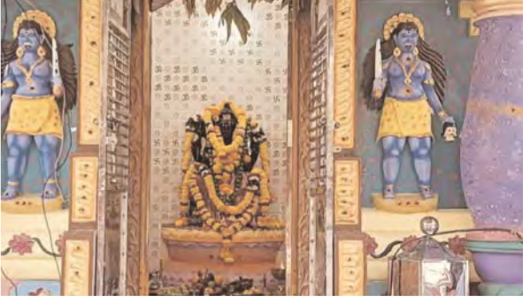
ఘనంగా కాళిమాత ఆలయ ప్రతిష్ఠ