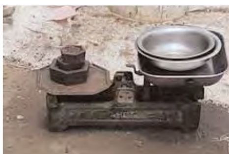
వినియోగదారుడి జేబుకి చిల్లు

వినియోగదారుడి జేబుకి చిల్లు కేటబోమ్యాలి, ఏప్రిల్ 12 (ప్రభాతవార్త) : నిత్యావసర సరుకులతో పాటు కరగ గాయలు, పండ్లు, బియ్యం ధరలు చక్కలు చూస్తున్నారు. మూడుపూలూ అన్నం తినడం కూడా తలకు మించిన భారంగా మారింది.